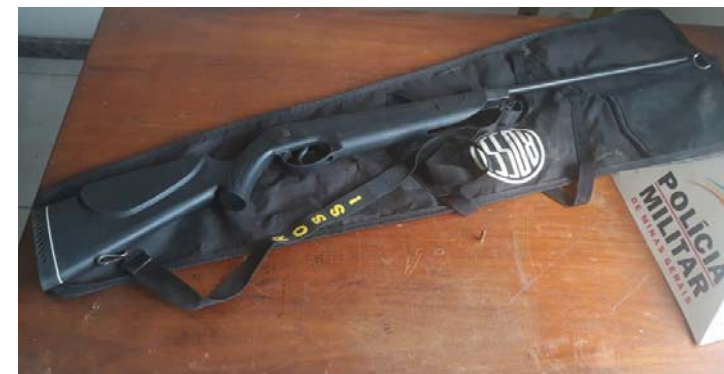
Arma apreendida no córrego da Tenda

Diante dos fatos o proprietário da residência foi encaminhado à Delegacia de Polícia Civil juntamente com o material apreendido.