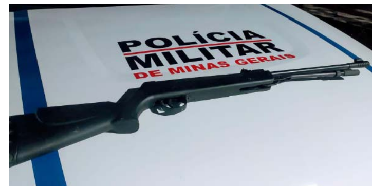
Arma apreendida no córrego São Roque