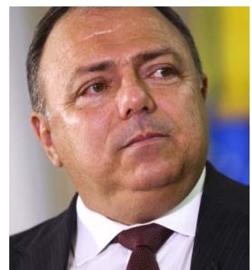
Sobre a vacina da Pfizer, o ministro destacou os esforços para resolver as “imposições que não encontram amparo na legislação brasileira”